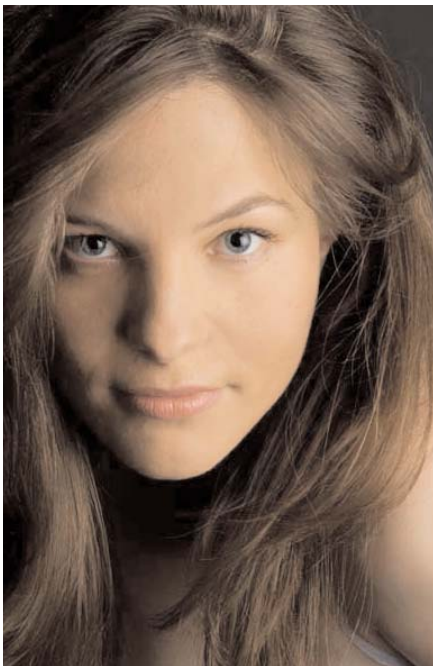
Die Portraitaufnahme wurde subtil mit Softbox und Reflektor beleuchtet.

CL: Bewegung ist in der Arbeit meines Mannes zentral. Wir arbeiten oft zusammen. Er hat mich auch zu meinem Buch inspiriert, welches nächsten Sommer publiziert wird. Es geht um die eigene