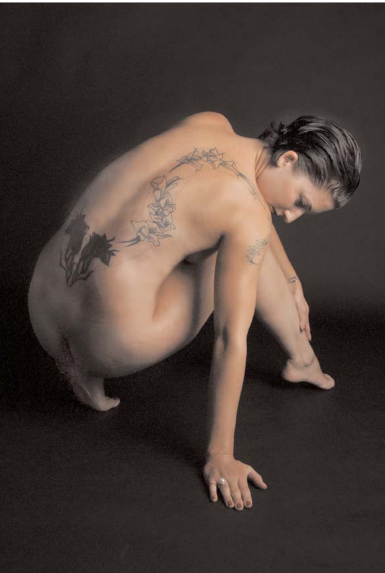
Kunstvolle Tätowierung – künstlerisch inszeniert.