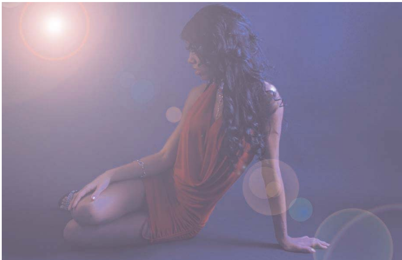
Studio Aufnahme mit sichtbarem Gegenlicht als Stilelement.